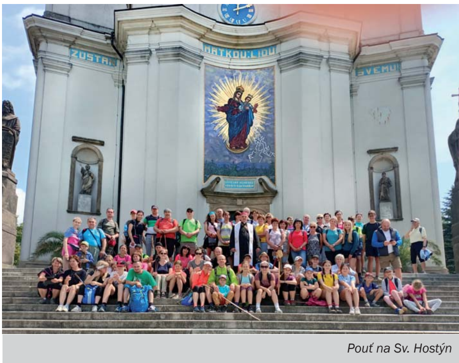
Pouť na Sv. Hostýn

Maria je tak úžasná. Ani jsem se nenadál a pocítil její blízkost. Stalo se totiž, že asi v polovině cesty mě začal bolet kotník. Šli jsme zrovna po kamenité cestě, takže kotník dostal zabrat. Říkal jsem si, že to asi nedám. Začal jsem i pokulhávat. Přišlo mi na mysl, abych tuto bolest odevzdal Panně Marii, aby ji použila k záchraně duší. S tímto úmyslem jsem šel dál a na kotník na chvíli zapomněl. Ale ne na dlouho, neboť jsem si brzy uvědomil, že se mi jde nějak dobře. Kotník přestal bolet! V ten moment jsem se usmál a usmíval se ještě hodnou chvíli. Věděl jsem, že mě kotník nepřestal bolet jen tak z ničeho nic. V duchu jsem děkoval Marii za ten malý zázrak, který učinila. Takže co dodat? I když nám chvíli přšelo, mé srdce se nepřestalo usmívat.