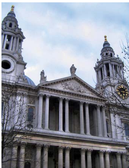
Katedrála sv. Pavla

Katedrála sv. Pavla – je mistrovským dílem Sira Christophera Wrena a zároveň sídlem londýnského biskupa. Stavba, která trvala 35 let, byla zahájena okamžitě po velkém požáru v roce 1666, jež zničil původní kostel, který byl již v roce 1650 zrušen parlamentními vojsky. Velkolepá katedrála