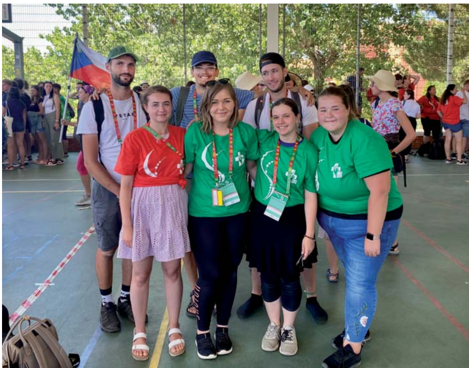
Světové dny mládeže

vání společných mší a vnímání Boží přítomnosti. Po týdnu jsme se přesunuli do Lisabonu. Uuufff, a teď to začalo, milion a půl lidí, každý z jiného kouta světa v jednom městě a přitom všechny něco spojuje, a to láska v Boha. Ne-sktečné! Tyto dny jsem prožila něco, co se nedá ani slovy popsat. Tolik jsem toho viděla, tolik jsem toho nachodila, tak málo hodin naspala, tolik nových skvělých lidí potkala, tolik nového zkusila, tolika dopravními prostředky jela. Taky jsem zjistila, že dopravní značky v Portugalsku jsou spíš na ozdobu, a že první jede ten, kdo víc troubí. Cítila jsem tolik emocí jako nikdy, neby-