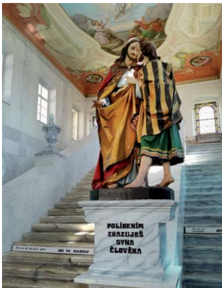
„Svaté schody“ Králíky