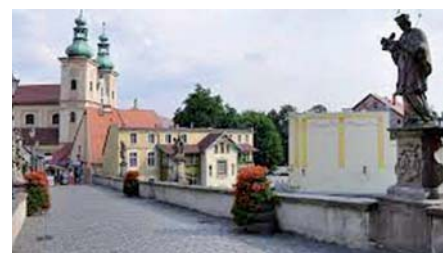
Klodzko - starší bratr Karlova mostu