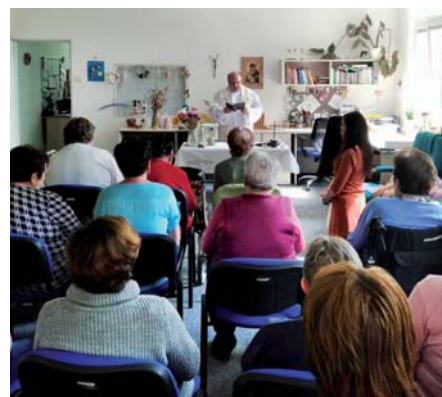
Májová pobožnost ve stacionáři