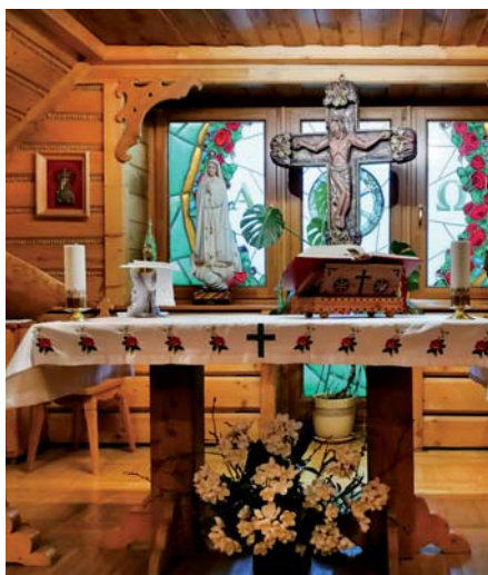
Cyryla - kaple