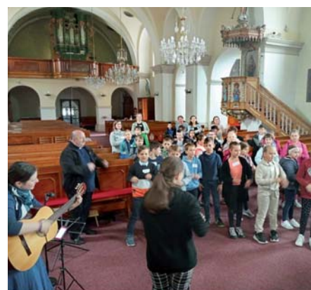
Duchovní obnova dětí třetích tříd