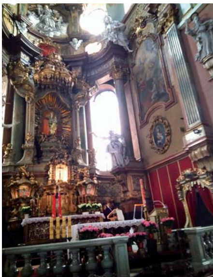
Klodzko-hlavní oltář s Madonou s dítětem

Po obědě jsme se vraceli domů přes město Klodzko . Tam jsme se zastavili v bazilice, kde se v přední části severní lodi nachází mramorový hrob Arnošta z Pardubic. Zaspívali jsme si naši českou hymnu, prošli kamenný most, který připomíná náš Karlův most a ochutnali místní zmrzlinu.