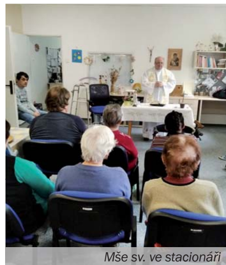
Mše sv. ve stacionáři

V rámci programu Denního stacionáře pořádáme akce i pro veřejnost. Mezi ně patří pravidelná mše svatá, různé přednášky, tvoření a podobně. Dvakrát ročně pořádáme poutní zájezd. Tento program vychází každý měsíc jak zde ve Farním měsíčníku, tak i v městském zpravodaji.