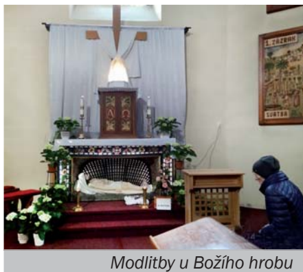
Modlitby u Božího hrobu