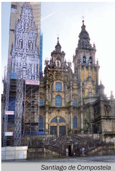
Santiago de Compostela

V letech 2009 a 2014 jsem navštívil Španělsko a v něm konkrétně města Santiago de Compostela, Barcelona a poutní místo Montserrat. Ve dvoudílném cyklu vám postupně představím výše jmenovaná poutní místa.