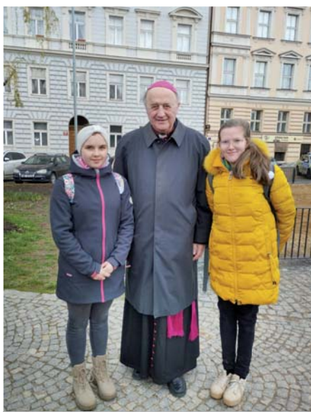
Pochod pro život v Praze