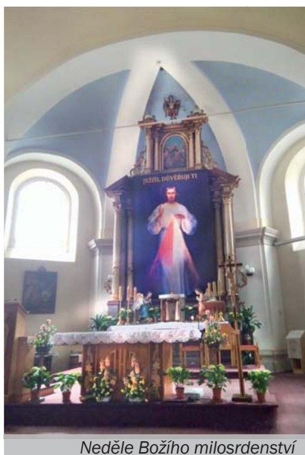
Neděle Božího milosrdenství