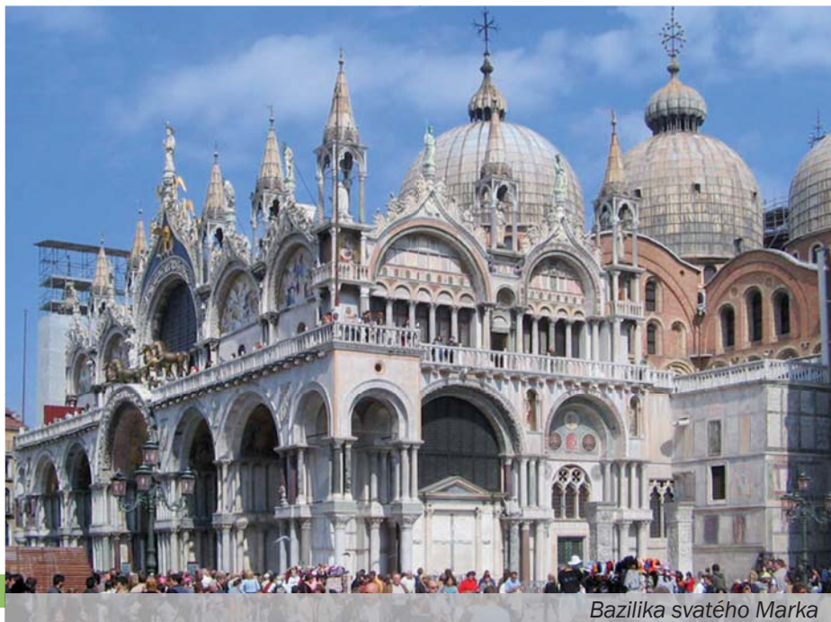
Bazilika svatého Marka

Baptisterium San Giovanni – je druhým nejstarším kostelem Florencie. Křtitelnice sv. Jana byla postavena v 11. – 12. století na místě kostela, který tady stál již někdy v 8. století. Vnější část kostela je podobně jako katedrála bohatě zdobena mramorovým obkladem různých barev. Nejobdivovanějšími částmi baptisteria jsou jeho bron-