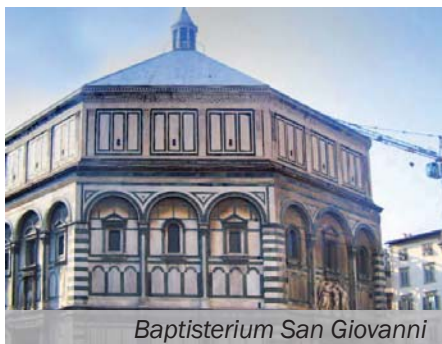
Baptisterium San Giovanni

zové dveře, a to obzvláště jeho východní tzv. Rajská brána, která se nachází naproti hlavnímu vchodu do katedrály. Bránu zdobí deset pozlacených reliéfů, které znázorňují výjevy ze Starého zákona a které jsou dílem Lorenza Ghibertiho. Severní brána pochází také od L. Ghibertiho a vznikla v 15. století. S prací na jižní bráně začal v 1. polovině 14. století Andrea Pisano, dokončil ji Vittorio Ghiberti, syn Lorenza. Také interiér baptisteria je hezký, a to zejména kupole s mozaikami ze 13. – 14. století s Ježíšem Kristem jako centrálním motivem.