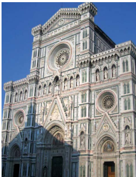
Katedrála Santa Maria del Fiore