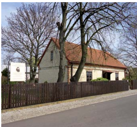
Głogowiec-rodný dům sv. sestry Faustíny

Neposkvrněného početí Panny Marie v jejich práci a také aby vyprošovaly milosti přicházejícím poutníkům. Od té doby se sestry modlí společně s poutníky na místě, kde se roku 1850 zjevila Matka Boží. Klauzurovaná kontemplativní komunita sester byla založena r.1502 sv. Janou Francouzskou. Podle stejné řehole byl o půl století později schválen i mužský řád kněží Mariánů Neposkvrněného početí Panny Marie. Sestry se snaží svým životem následovat deset Mariiných ctností, aby se tak připodobnily Ježíšovi.