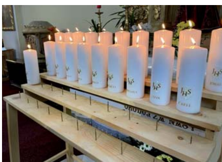
Svíčky prvopřijímajících dětí