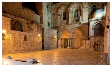
Bazilika Božího Hrobu