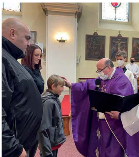
Představení prvopřijímajících dětí