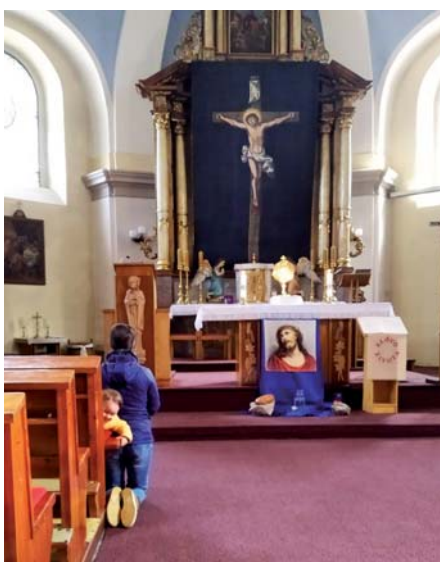
Valašsko se modlí za mír na Ukrajině