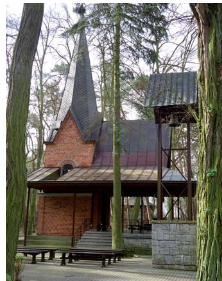
Grablinský les-Kaple borovice

Tímto pojednáním o Grąblinském lese, Głogowci a Świnicích Warckých již potřetí pokračujeme v cyklu Poutnické Polsko.