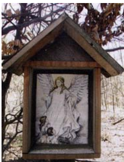
Památná místa farnosti Brumovské

Tento obrázek zde neznáma kdy umístila žena z Popova, která se tudy vracela, zabloudila a musela zde přespat. Na poděkování za šťastné přežití zde umístila obrázek anděla strážného.