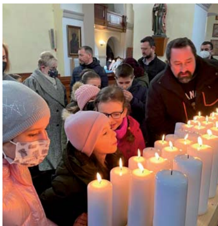
Svíčky prvopřijímajících dětí