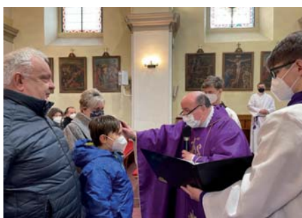
Představení prvopřijímajících dětí