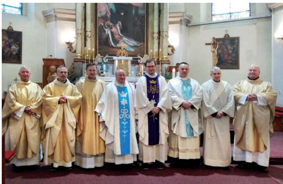
Naši kněží mariáni při slavnosti Neposkvrněného početí Panny Marie