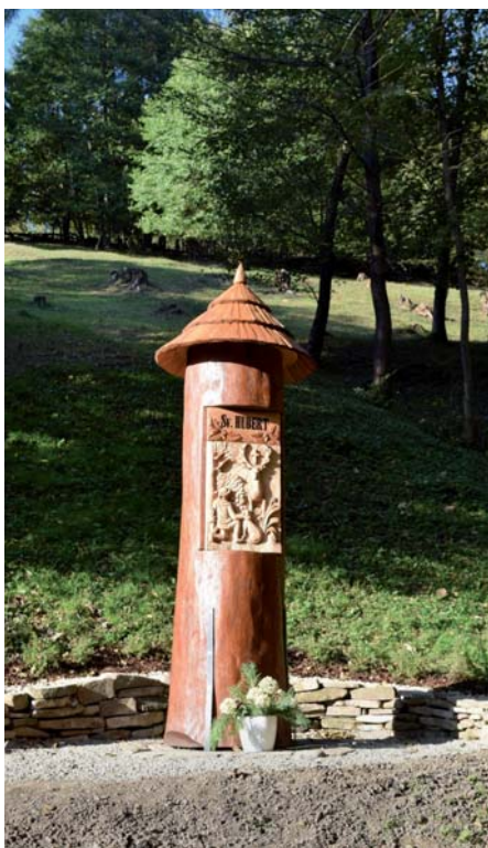
Dřevorezba sv. Huberta