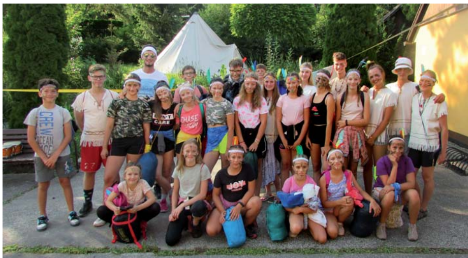
Ještě jedna vzpomínka na prázdninové léto našich dětí

Kafarnaum je významná archeologická lokalita na břehu Genezaretského jezera. Původně zde byla starověká rybářská vesnice, později židovské a dosud křesťanské poutní centrum. Jeho existence je známa z evangelií, mj. jako působiště Ježíše Krista a sv. Petra. Kafarnaum bylo osídleno od 2. století př. n. l. a opuštěno někdy před křížovými výpravami. Kafarnaum je opakovaně zmiňováno v evangeliích. Ježíš v sousední Betsaidě získal apoštolů – místní rybáře a z Kafarnaum učinil své působiště. Kázal zde v synagoze, učinil zde mnoho zázračných uzdravení a povolal celníka Matouše. Památky: synagoga se sloupovým nádvořím, dostavěná ve 4. - 5. století n. l. na základech starší synagogy (ve které kázal Ježíš), jedna z nejvýznamnějších antických architektonických památek této doby v Izraeli; podle bohaté architektonické výzdoby stavěná pravděpodobně za podpory římského císaře Juliána. Byzantský chrám z 6. století - základy na osmibokém půdorysu.