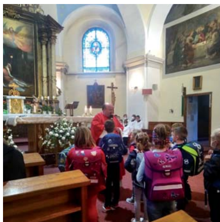
Zahájení školního a katechetického roku