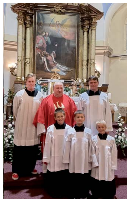
Přijímání nových ministrantů