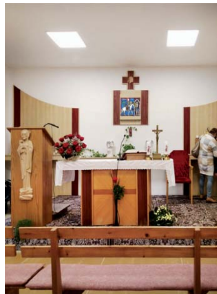
Kaple v Sidonii