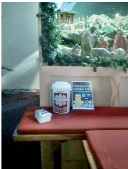
Kasička pro Tříkrálovou sbírku