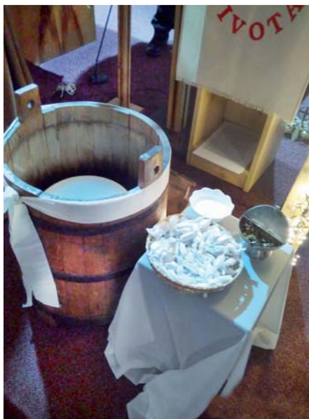
Svěcení vody, soli a křídý