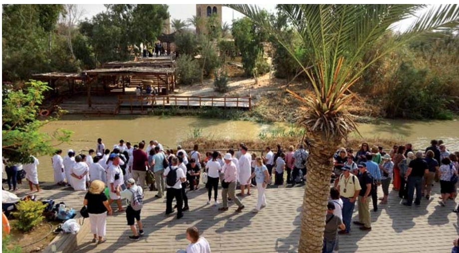
Qasr al Yahud