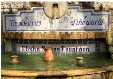
Elíšův pramen v Jerichu