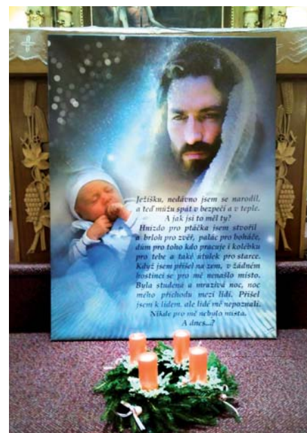
Svěcení adventních věnečků