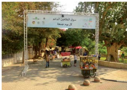
Zacheův strom v Jerichu - vpravo