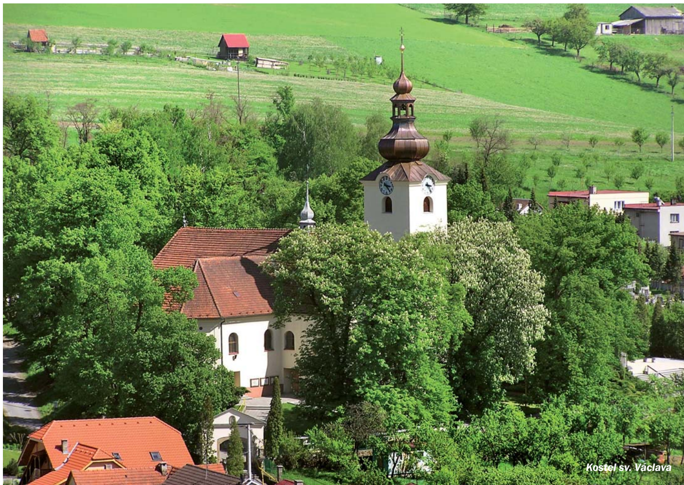
Kostel sv. Václava

Zpravodaj Římskokatolické farnosti sv. Václava ● Brumov-Bylnice ● Sv. Štěpán ● Sidonie