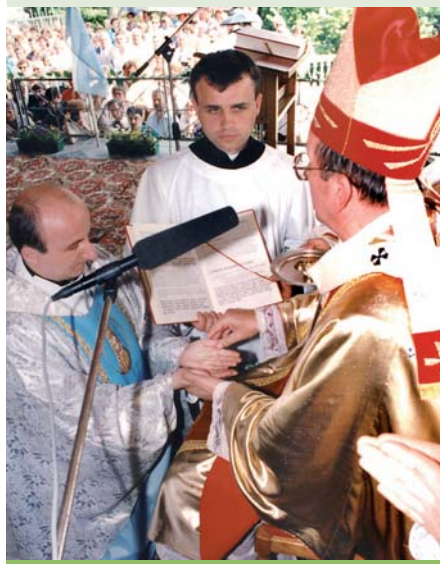
Svěcení 27. 5. 1995