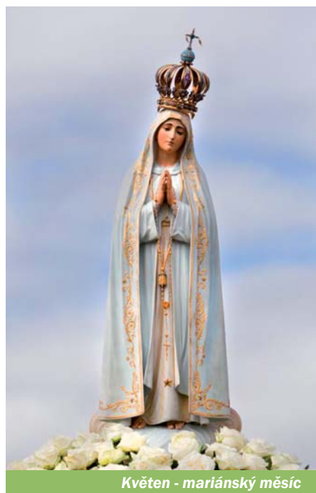
Květen - mariánský měsíc