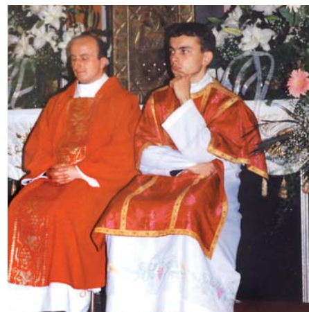
První mše svatá