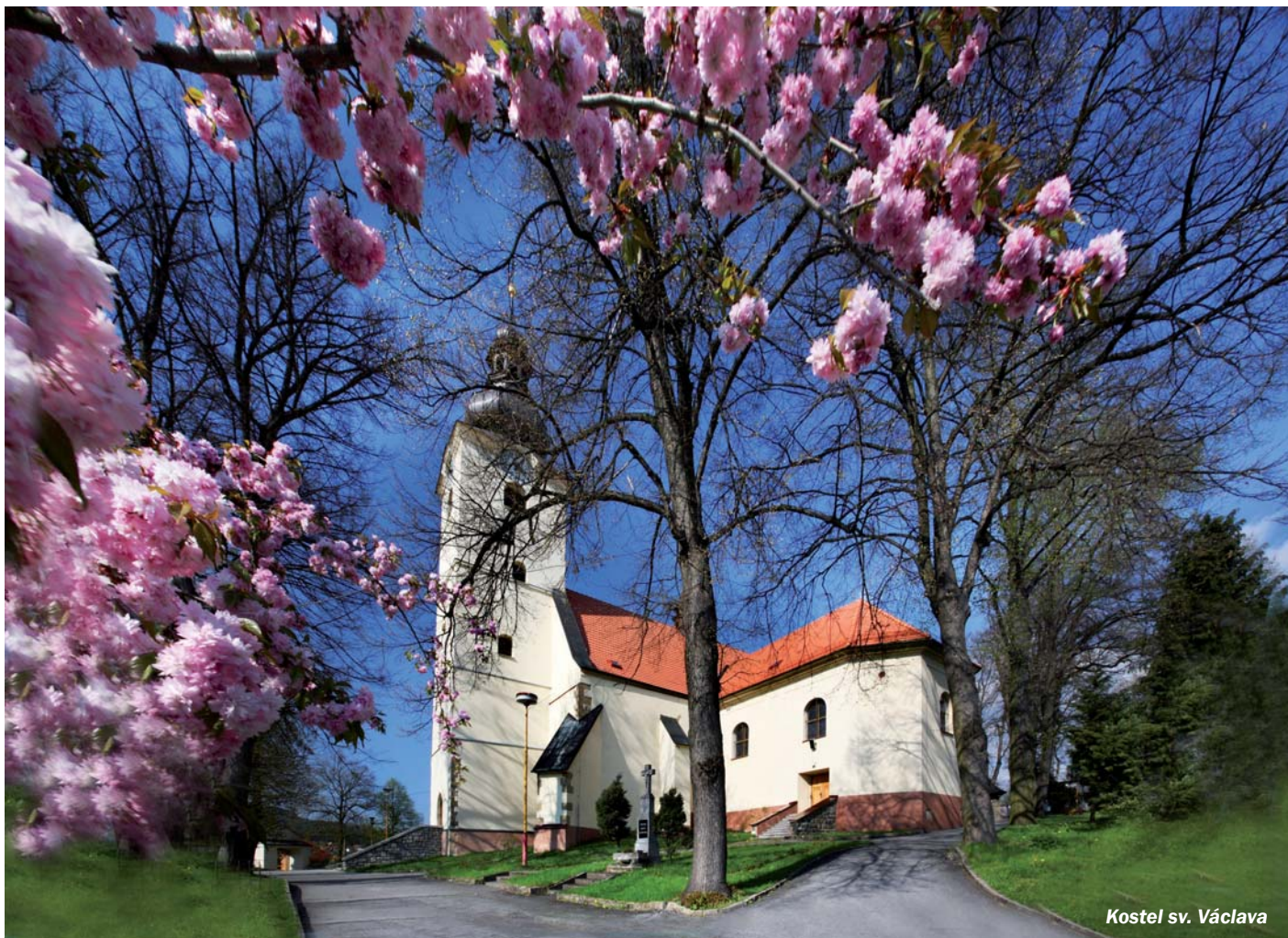
Kostel sv. Václava

Zpravodaj Římskokatolické farnosti sv. Václava ● Brumov-Bylnice ● Sv. Štěpán ● Sidonie