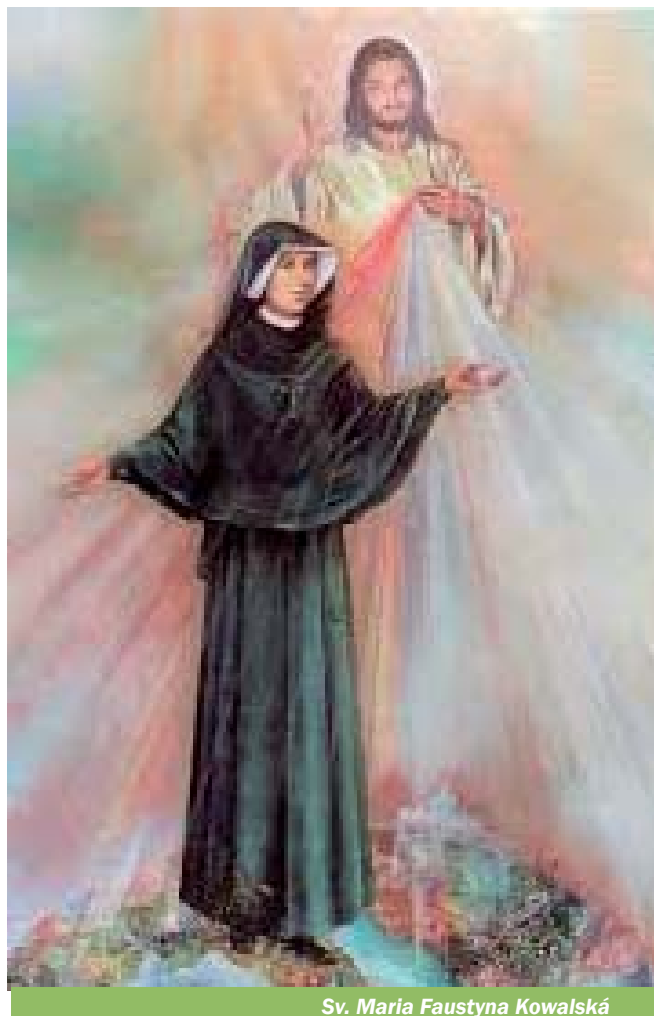
Sv. Maria Faustyna Kowalská