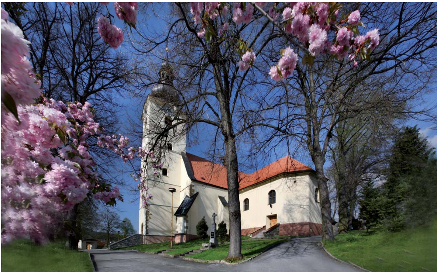
Kostel sv. Václava