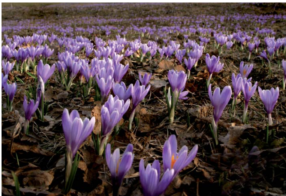
Jaro je tady