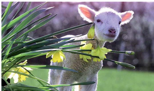
Velikonoce- nový život