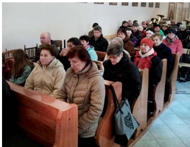
Farní pouť na Sv. Hostýně - křížová cesta v kapli