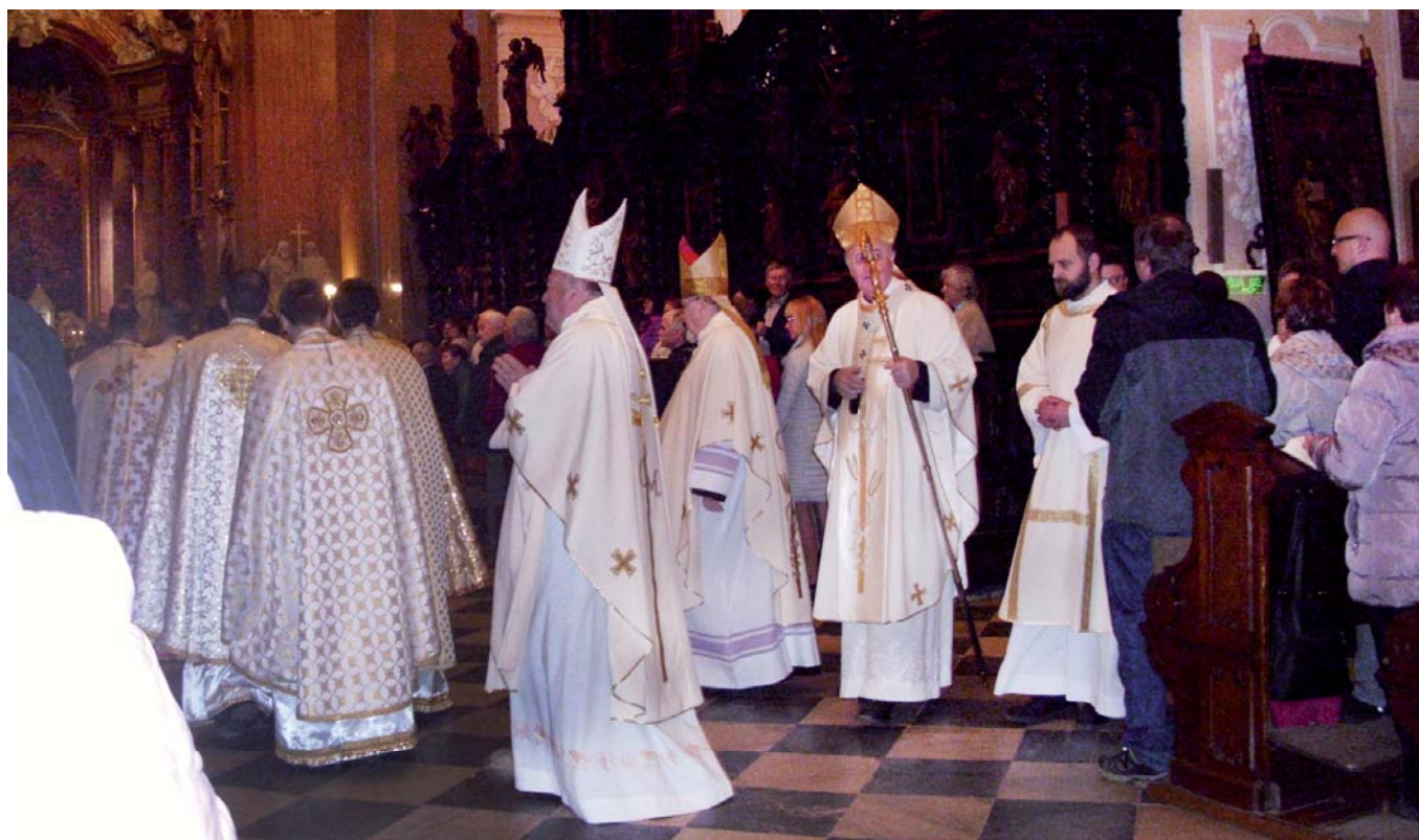
Děkanátní pouť na Velehradě