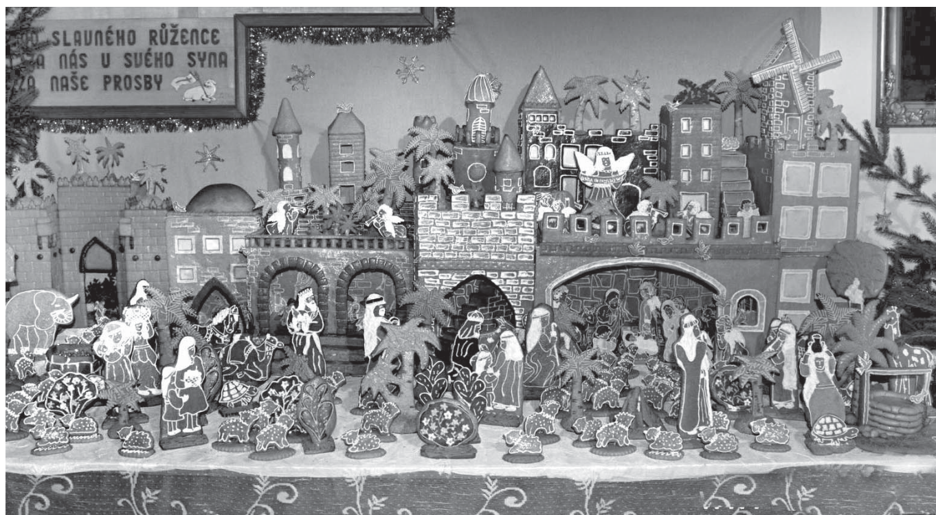
Letošní perníkový betlém

na glazování. Holky na toho anděla stříkaly voňavky a laky na vlasy. Byli jsme dost opilí, při té naší hrozné práci jsme se pořád smáli a děvčata se hihňala. Představovali jsme si, co se stane, až kolega vytáhne anděla, strašidelného bubáka.