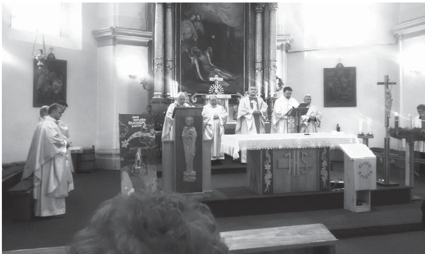
Mše sv. 8. 12., při které mariáni obnovují své řeholní sliby